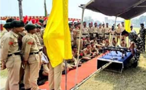
कंपीटिशन में भागीदारी की और वॉली बॉल के सेमी फाइनल का पुरजोर अभ्यास किया।वहीं दूसरी ओर जूनियर डिविजन के कैडेटों ने