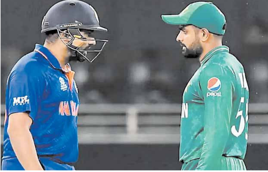
इनके अलावा न्यूट्रल वेन्यू पर भी भारत और पाकिस्तान ने बहुत सारे वनडे मैच खेले हैं। भारत ने न्यूट्रल वेन्यू पर 34 मैचों में पाकिस्तान को हराया है, जबकि पाकिस्तान न्यूट्रल वेन्यू पर 40 बार भारत को मात दी है।

भारत ने पाकिस्तान जाकर पाकिस्तानी पिचों पर पाकिस्तान के खिलाफ 11 वनडे मैचों में जीत हासिल की है। वहीं, पाकिस्तान की टीम ने भारतीय पिचों पर भारत के खिलाफ 19 मैचों में जीत हासिल की है।