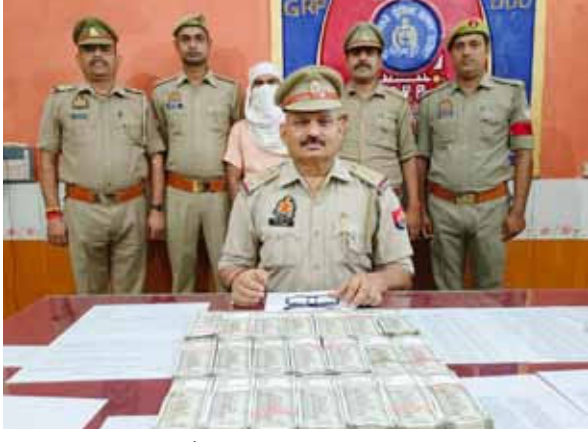
पास स्थित एक पिटडू बैग से कुल 10 लाख 50 हजार रुपये बरामद हुए। जवानों द्वारा रुपयों के बाबत पूछा गया तो व्यक्ति से संतोष जनक जवाब नहीं मिला। जिसके बाद जवानों ने व्यक्ति को गिरफ्तार कर लिया।

शुभ भास्कर, चंदौली। चंदौली के डीडीयू जीआरपी के जवानों ने चेंकिंग के दौरान एक संदिग्ध व्यक्ति को गिरफ्तार कर उसके पास से कुल 10 लाख 50 हजार रुपये बरामद किया है। फिलहाल जीआरपी आगे की कार्यवाही में जुटी हुई है। एफओबी सीडी के पास से हुई गिरफ्तारी दरसअल, उच्चाधिकारियों के निर्देश पर रेलवे में अपराध की रोकथाम के लिए लगातार अभियान चलाया जा रहा है। इसी क्रम में जीआरपी के जवानों ने चेंकिंग के दौरान प्लेटफार्म संख्या 1/2 स्थित फुट ओवर ब्रिज के पास स्थित सीडी के पास खड़े एक संदिग्ध व्यक्ति की तलाशी में व्यक्ति के