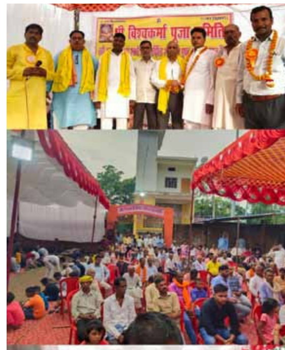
होती है ऐसी मान्यता है कि इस दिन भगवान विश्वकर्मा ने सुष्टि के रचयिता ब्रह्मा जी के सातवें पुत्र के रूप में जन्म लिया था

भगवान विश्वकर्मा का जिक्र 12 आदित्यों और ऋग्वेद में होता है हिंदुओं के लिए यह त्यौहार बहुत महत्वपूर्ण होता है इस दिन हर समाज के लोग अपने कारखानों और वाहनों की पूजा करते हैं कई शास्त्रों में है कि विश्वकर्मा जी ने द्वारिकापुरी लंका इंद्रलोक शुष्क विमान देवताओं के अस्त्र-शस्त्र का निर्माण किया था इसी कड़ी में पूरे जिले में जगह-जगह कार्यक्रम का आयोजन हुआ अमर बिल्डिंग वर्क पर विशाल भंडारे का आयोजन हुआ जरेला बाजार मंदिर पर कार्यक्रम हुआ गुलालपुर विश्वकर्मा मंदिर पर भंडारे का कार्यक्रम हुआ अमानीगंज में विश्वकर्मा मंदिर पर पूजा और भंडारे का आयोजन हुआ इसी तरह पूरे जिले में विधि विधान से पूजा का आयोजन हुआ विश्वकर्मा ब्रिगेड के पदाधिकारी द्वारा जिले के कई कार्यक्रमों में पहुंचकर अपने आराध्य देव श्री विश्वकर्मा भगवान की पूजा कर बड़े बुजुर्गों का आशीर्वाद प्राप्त किया।