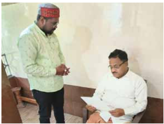
दिसम्बर से 20 दिसम्बर तक चार दिवसीय जनजागरण रथ यात्रा

चंदौली। भाजपा के राष्ट्रीय महामंत्री व राज्य सभा सांसद डा.राधा मोहनदास अग्रवाल उनके आवास पर शनिवार को देर शाम अखिल भारतीय देववंशी पटवा समाज का प्रतिनिधि मंडल राष्ट्रीय महामंत्री आकाश पटवा के नेतृत्व में मुलाकात किया। इस दौरान समाज की ओर से आगामी 17 दिसम्बर से वाराणसी से निकलने वाली जन जागरण रथ यात्रा पर चर्चा किया। अखिल भारतीय देववंशी पटवा समाज अपनी राजनैतिक सामाजिक और शैक्षिक विकास और पहचान को लेकर लम्बे समय से गांव से लेकर नगर तक पहल तेज कर दिया है। इस क्रम में आगामी 17