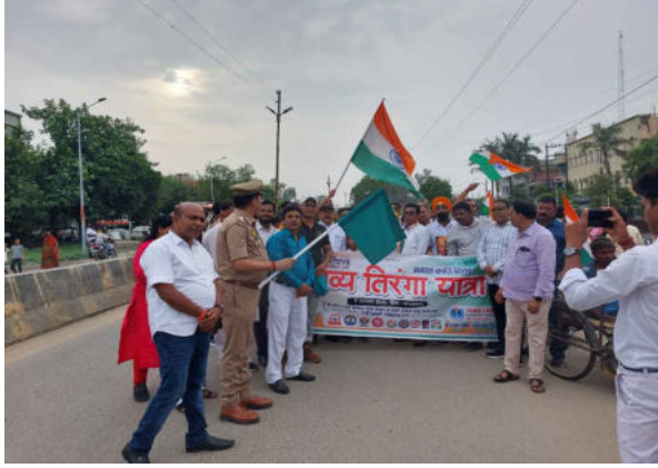
दैनिक शुभ भास्कर