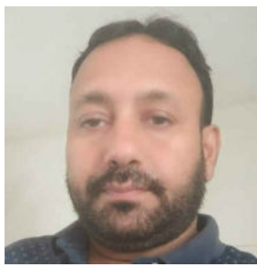
राज्यकर्मी घोषित करने को लेकर लाखों शिक्षकों ने किया था विधान सभा घेराव

प्रदर्शनकारी शिक्षक नेताओं और शिक्षकों पर नियमविरुद्ध दंडात्मक कार्यवाही कर शिक्षकों के गुस्से को भड़काने का कार्य कर रहा है। देश संविधान से चलता है और संविधान के तहत हर नागरिक और कर्मचारियों के प्रदत्त अधिकारों को कुचलने का मतलब है संविधान की हत्या करना। कहा कि प्रदर्शनकारियों पर कार्यवाही लोकतंत्र की हत्या है। कहा कि दुर्भावना से प्रसिद्ध होकर धरना प्रदर्शन में शामिल होने वाले नेतृत्वकर्ताओं को टारगेट कर बिना वजह नोटिस भेजकर मानसिक रूप से प्रताड़ित किया जा रहा है, जो बर्दाश्त से बाहर हो रहा है। कहा कि जब नियम कानून के तहत प्रदर्शन किया गया