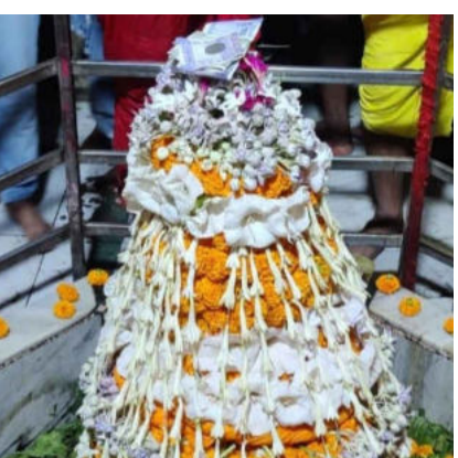
3 मटेश्वरधाम मंदिर के शिवलिंग का किया गया श्रृंगार पूजा

झांसी उत्तर प्रदेश, उदयापुर, राजस्थान मध्यप्रदेश, भोपाल, बिहार, दरभंगा पटना, भागलपुर, सिलीगुड़ी, रांची, झारखंड, से एक साथ प्रकाशित