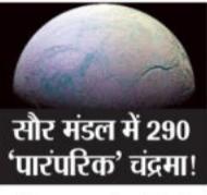
सौर मंडल में 290 'पारंपरिक' चंद्रमा!

अंतिम गणना में हमारे सौर मंडल में 290 से कम 'पारंपरिक' चंद्रमा नहीं थे। हालांकि, केवल चंद्रमा को देखने का मतलब यह नहीं है कि यह आधिकारिक तौर पर चंद्रमा है। कुछ नए उपग्रह पहले भी देखे गए थे, लेकिन अंतर्राष्ट्रीय खगोलीय संघ द्वारा आधिकारिक तौर पर किसी को चंद्रमा कहने से पहले एक लंबी प्रक्रिया होती है। कई वर्षों के निरंतर अवलोकन के बारे में सोचें।