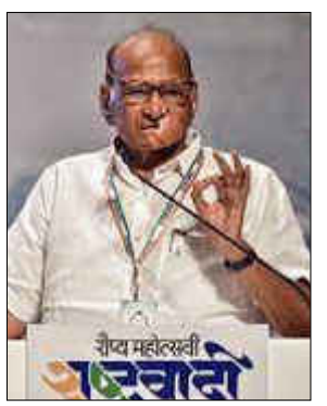
किया था, जिसमें पवार की रकांपा और कांग्रेस भी शामिल थी। एकनाथ शिंदे-देवेंद्र फडणवीस

राष्ट्रवादी कांग्रेस पार्टी (रकांपा) के अध्यक्ष शरद पवार ने शनिवार को एकनाथ शिंदे सरकार पर महाराष्ट्र में कानून व्यवस्था बनाए रखने में विफल रहने को लेकर निशाना साधा। शिंदे सरकार ने 30 जून को सत्ता में एक साल पूरा किया है। उद्धव ठाकरे के खिलाफ बग़ावत करने वाले शिंदे शिवसेना के विभाजन के बाद पिछले साल 30 जून को मुख्यमंत्री बने। शिंदे ने महाविकास अघाड़ी गठबंधन की सरकार से अलग होने का फैसला