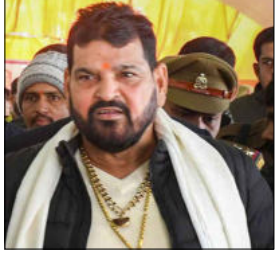
आरोपपत्र पर संज्ञान लेना है या नहीं। बृजभूषण भारतीय जनता पार्टी

दिल्ली की एक अदालत इस बात का फैसला सात जुलाई को करेगी कि महिला पहलवानों का कथित तौर पर यौन उत्पीड़न करने के मामले में भारतीय कुश्ती महासंघ (डब्ल्यूएफआई) के निवर्तमान अध्यक्ष बृजभूषण शरण सिंह के खिलाफ दिल्ली पुलिस द्वारा दायर