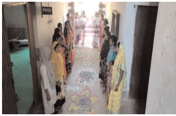
शुभ भास्कर संवाददाता पंकज भगत

पाकुड़ / महेशपुर पारखंड के रोलगाराम में खरछहर संस्था से बने संकुल संघ में सखीमंडल के दीदी द्वारा अंतर्राष्ट्रीय महिला दिवस का आगाज सजा दाजा कर बड़ी सान सोकत के संघ जेएसएलपीएस के बैनर तले महिला दिवस मनाया गया जिसमें महिलाओं को महिला सम्बन्धित बेसेश चर्चा किया गया इस कार्यक्रम को सफलता बनाने के लिए संस्था चालक द्वारा काफी चर्चा हुई, तथा सखिमंडल के बारे में भी काफी चर्चा हुई। सखीमंडल से जुड़ कर महिलाएं काफी गरबी में बलाव नजर अरे हैं, मौके पर उपस्थित संस्था के अनेक कार्यकर्ता गण मौजूद रहे