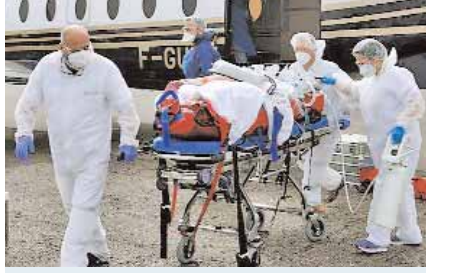
ब्राजील ने देसी टीका कोवैक्सिन लेने से मना किया

कोरोना की तीसरी लहर के बीच फ्रांस ने देश में एक महीने के लॉकडाउन का एलान किया है। फ्रांस के राष्ट्रपति एमैनुएल मैक्रॉन ने बताया कि कोरोना के बढ़ते खतरों के मद्देनजर अगले 3 हफ्तों तक स्कूल बंद रहेंगे। इंटर के बाद अगले एक महीने तक देश के अंदर भी यात्रा करने पर पूरी तरह से प्रतिबंध रहेगा। उन्होंने कहा कि हमें महामारी की तीसरी लहर से बचने के लिए लॉकडाउन लगाना ही होगा, नहीं तो यह अस्पतालों पर भारी पड़ सकती है। अगर अभी हमने अभी ठोस कदम नहीं उठाया, तो हम कोरोना पर नियंत्रण खो देंगे। उधर, ब्राजील में हालात दिन-पर-दिन बुरे होते जा रहे हैं। यहां बुधवार को 89,200 लोगों में कोरोना की कोरोना की पुष्टि हुई। इस दौरान रिकॉर्ड 3950 लोगों की मौत हुई। यह एक दिन में मरने वालों का सबसे बड़ा आंकड़ा है। इससे पहले एक दिन पहले ही 30 मार्च को 3668 लोगों की मौत हुई थी। यहां अब तक 1.27 करोड़ लोग कोरोना की चपेट में आ चुके हैं और 3.21 लाख लोगों की मौत हो चुकी है। फ्रांस के राष्ट्रपति ने बताया कि लॉकडाउन 2 अप्रैल से प्रभावी होगा और यह अगले 4 सप्ताह तक जारी रहेगा। टीवी संदेश में उन्होंने कहा कि इस दौरान केवल जरूरी सामान की दुकानों को खुलाने की इजाजत होगी और लोगों को दफ्तरों की बजाय घर से काम करना होगा। इस दौरान सार्वजनिक सभाओं पर पूरी तरह रोक होगी। अपने घरों से 10 किलोमीटर से अधिक दूर जाने पर भी रोक होगी।