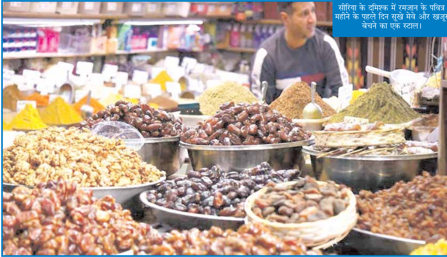
सीरिया के दमिश्क में रमजान के पवित्र महीने के पहले दिन सुखे मेवे और खजूर बेचने का एक स्टाल।