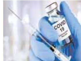
544269 लोगों को वैक्सीन लगाकर उन्हें कोराना से बचाने के प्रयास में बड़ा काम किया गया।

दिनों के टीका उत्सव में बिहार बहुत अच्छा प्रदर्शन नहीं कर सका। टीका की रफ्तार सामान्य दिनों से भी काफी कम रही। बाकी 3 दिनों में वैक्सीन की स्थिति सामान्य दिनों से भी कम रही है। 11 अप्रैल को जिस दिन उत्सव का शुभारंभ किया गया उस दिन 206354 लोगों का टीकाकरण हुआ, 12 अप्रैल को 149002 लोगों को ही टीका लग पाया। वहीं 13 अप्रैल को हालत और खराब हो गई। 13 अप्रैल को प्रदेश में कुल मात्र 56487 लोगों का ही टीकाकरण हो पाया। जबकि, 14 अप्रैल को उत्सव की समाप्ति के दिन 132426 लोगों का टीकाकरण किया गया। ऐसे में 4 दिनों के इस विशेष उत्सव में