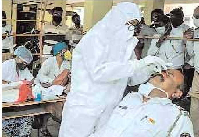
प्रमुख विपक्षी दल के नेता अखिलेश यादव तक कोराना पॉजिटिव होकर खुद को आइसोलेट कर चुके हैं। प्रदेश में बुधवार को कोराना संक्रमण के 20,510

उत्तर प्रदेश में कोराना से हालात बेकाबू हो गए हैं। हर रोज संक्रमितों का नया रिकॉर्ड बन रहा है। प्रदेश के मुख्यमंत्री योगी आदित्यनाथ से लेकर